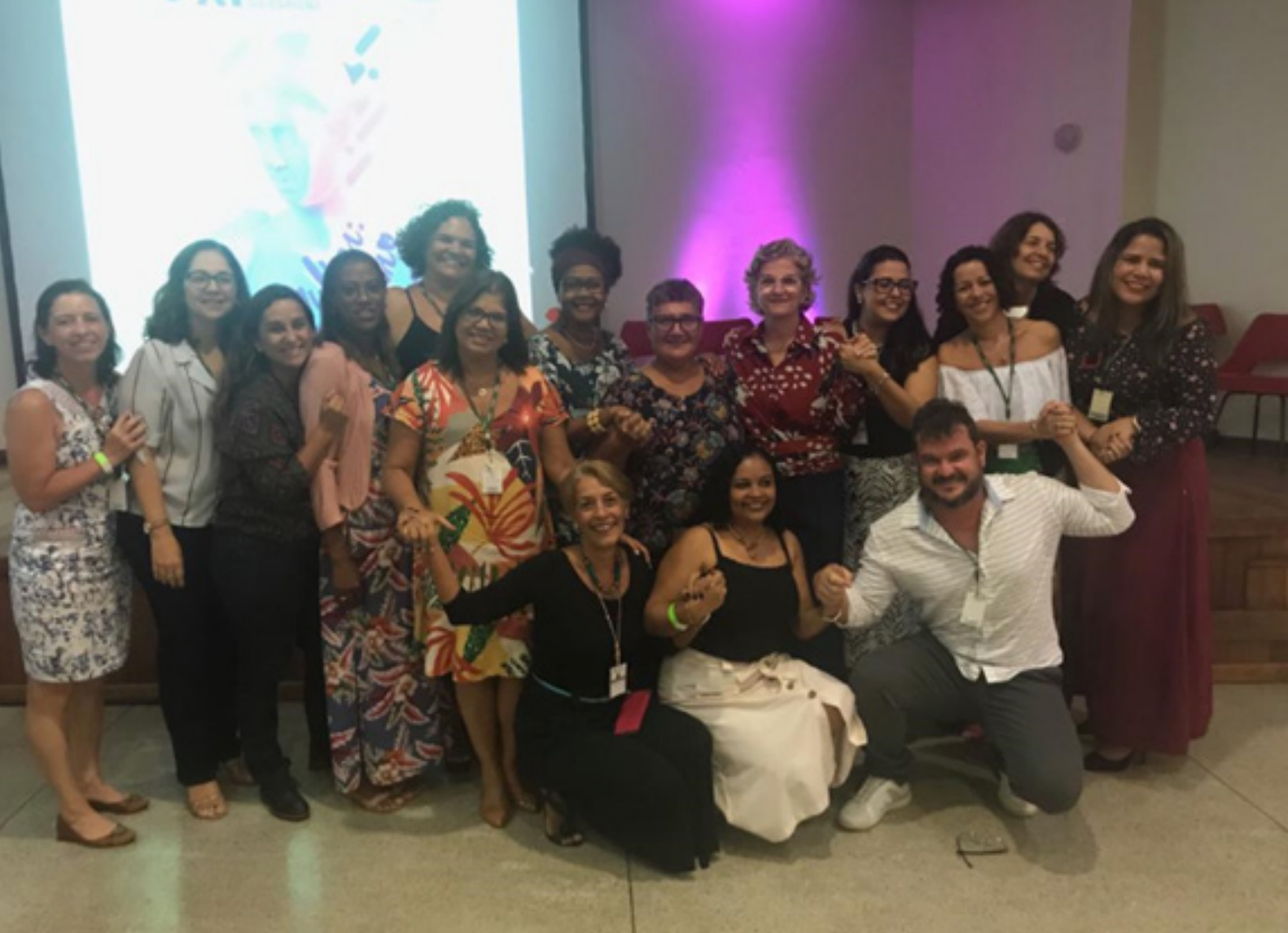
Escola Bahiana de Medicina e Saúde Pública