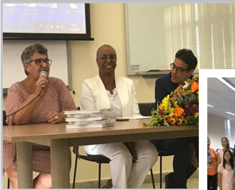
Vitória da Conquista