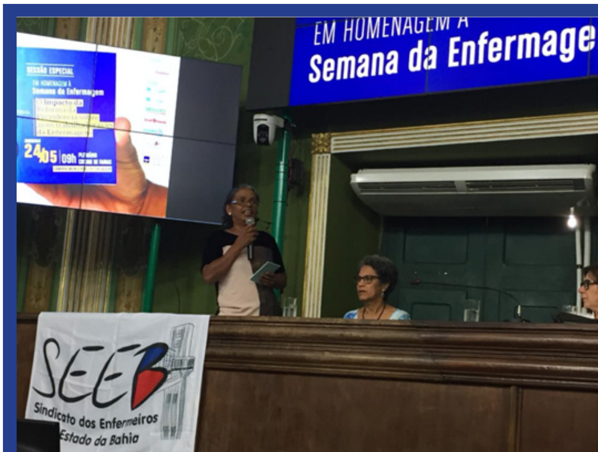
Audiência Pública na Câmara de Vereadores de Salvador sobre Impactos da Reforma da previdência para trabalhadoras da enfermagem