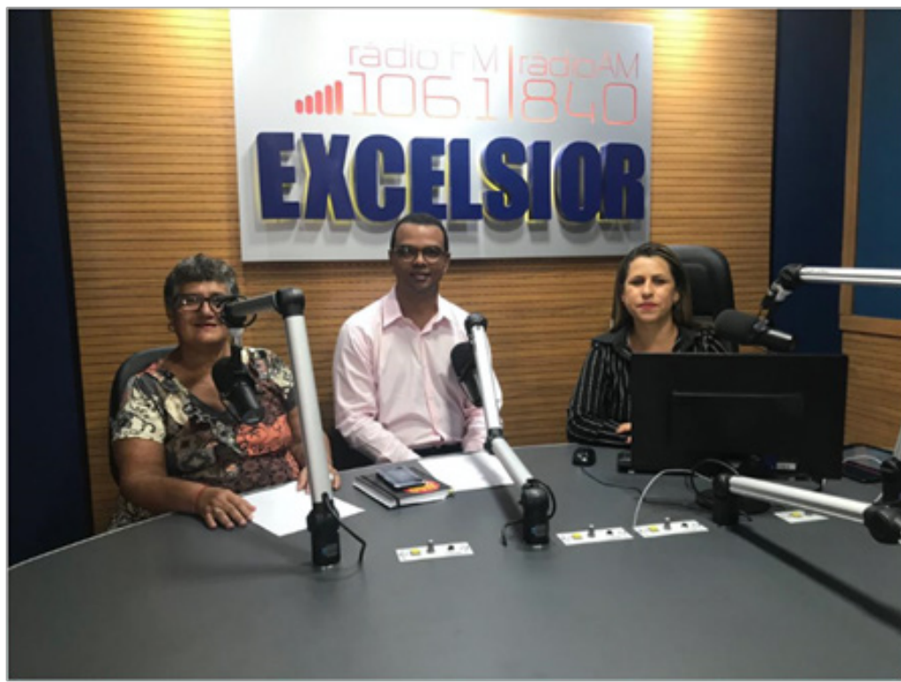
Programa Saúde no Ar Rádio Excelsior